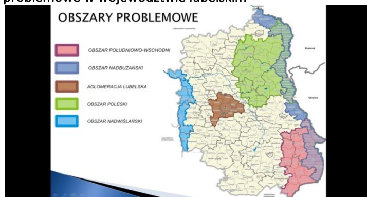
Ilustracja 3: Obszary problemowe w województwie lubelskim