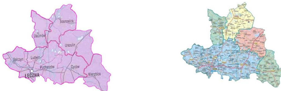
Ilustracja 1: Granice administracyjne Lokalnej Grupy działania „Polesie”